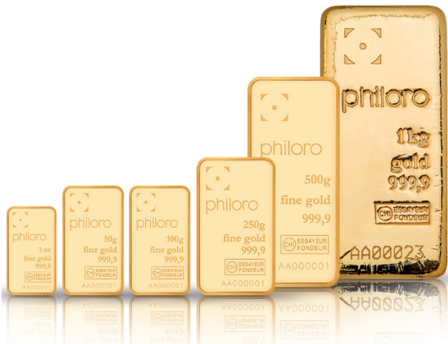
S.11 - VON DER MINE BIS ZUM BARREN