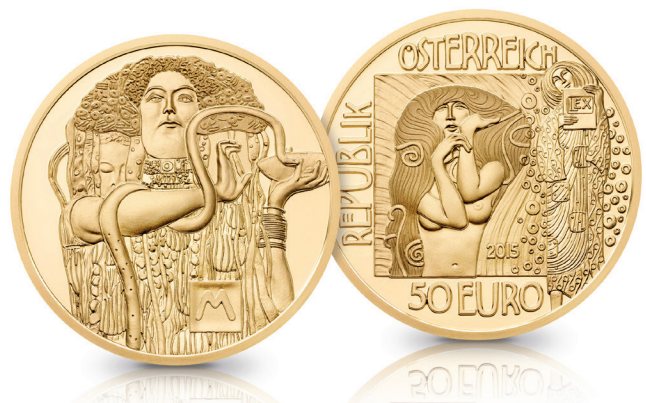
S.14 - 50 EURO GOLDMÜNZE „MEDIZIN - KLIMT“ PP