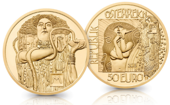
S.14 - 50 EURO GOLDMÜNZE „MEDIZIN - KLIMT“ PP